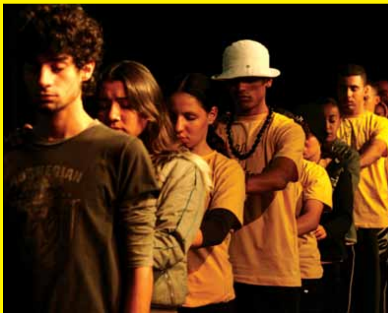
Momento do workshop do CONEXÕES 2008 (acima).