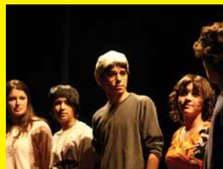
CSL no Conexões: 2007 – "Peça de Horror", de Judith Johnson e 2008 - "Uma História de Vampiro" de Moira Buffini (abaixo).