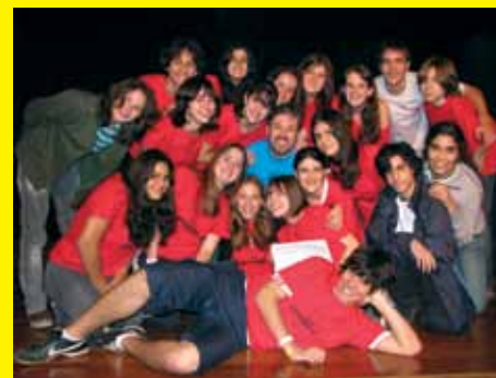
Grupo de teatro do Colégio São Luís